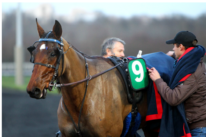
Gunilla d'Atout , princesse devenue reine de sa génération avec sa victoire dans le Critérium des 3 ans.