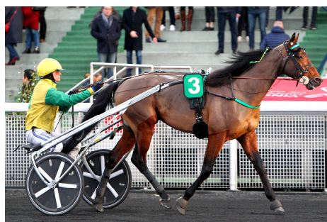
1er FACE TIME BOURBON