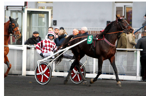
3ème FRISBEE D'AM