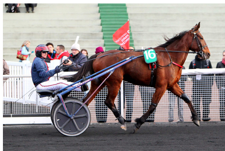
2ème FLECHE DU YUCCA