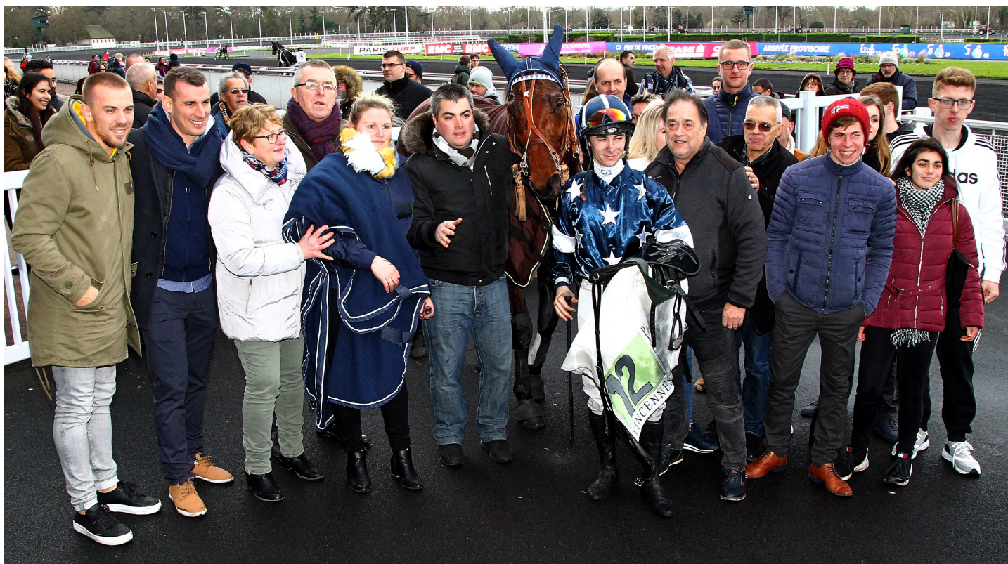
Gangster du Wallon avec son entourage après sa victoire dans le Prix de Vincennes (Groupe I)