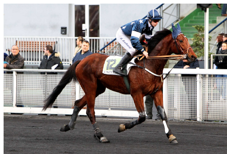
1er GANGSTER DU WALLON