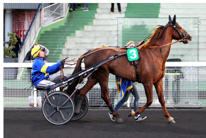
2ème GU D'HERIPRE