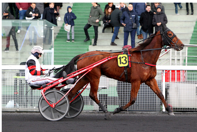
Toujours plus haut, rien ne résiste à Cleangame , le nouveau "meilleur hongre français".

Lauréate des deux semi-classiques pour les pouliches qui précédait le Critérium des 3 ans (Groupe I), Gunilla d'Atout a gagné ses galons de classique dans le premier grand rendez-vous du meeting d'hiver.