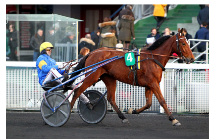
3ème GALILEA MONEY