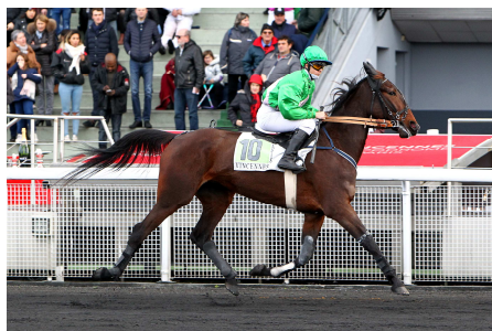
2ème GRACE DE FAEL