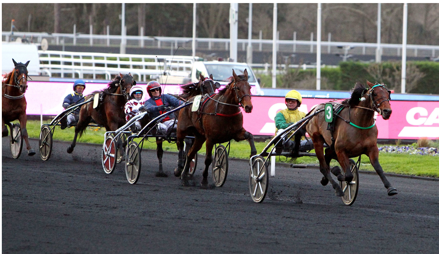
Face Time Bourbon s'impose en devançant Flèche du Yucca, Frisbee d'Am et Flight Dynamics