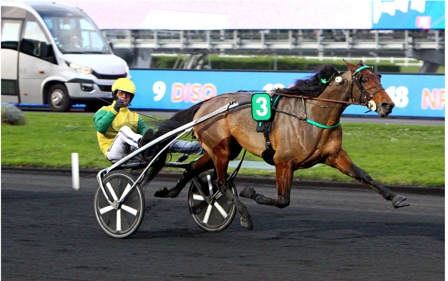
Face Time Bourbon et Björn Goop en pleine action et aux abords du poteau.