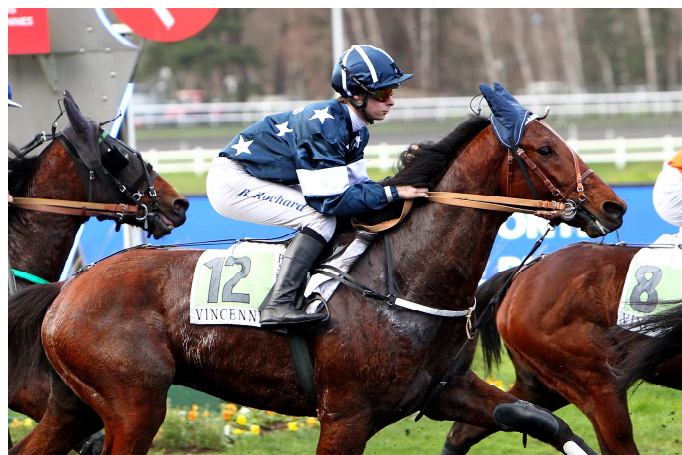
Gangster du Wallon a offert à son entourage un premier Groupe I avec le Prix de Vincennes.

Après avoir rendu facilement cinquante mètres dans une étape du G.N.T. disputée en terre nantaise, Cleangame a fait de même dans la Finale du G.N.T. (Groupe 2), avant de poursuivre avec le Prix Jean Dumouch (Groupe 3), tout aussi aisément. Il est le héros du mois de décembre.